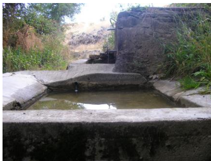
Fuente y lavaderos de El Pozo, construida en 1956

En 1956 Sarnago contaba con 462 habitantes. Se canalizó la antigua fuente de 1748 hasta una nueva unos metros más lejos, lo que supuso un avance en general, pero principalmente para las mujeres, puesto que a partir de esta fecha se evitaba el tener que ir, en especial durante los meses de verano, hasta “Los Rincones” y “Orcajo” con tanta frecuencia al disponer de dos lugares donde hacer la colada. La distancia hasta “Los Rincones” (cerca de la Virgen del Monte) era aproximadamente de 45 o 60 minutos y a “Orcajo” de 30 minutos de bajada y otros tantos de subida.