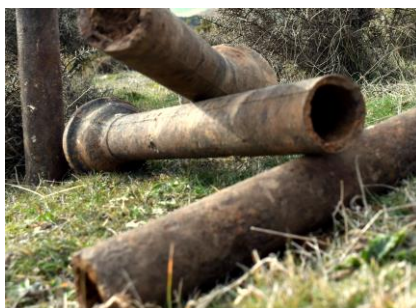
Tubería de hierro instalada en 1917

El 21 de octubre del año 1917, una columna titulada "Desde Sarnago", el corresponsal da cuenta de que se trae el agua desde el paraje llamado "la Lagunilla" por medio de vasos comunicante. Son 1200 metros de tubería que terminan en un depósito enterrado de aproximadamente 30.000 litros, construido en mampostería con cal. Bastante bien construido y sin fugas lo que