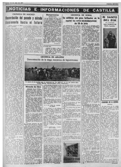
Recorte de prensa donde se cita la fuente de El Pozo de Sarnago

A partir de 1980 se van realizando varios arreglos en ambas fuentes, cambios puntuales de tuberías, principalmente por medio de hacenderas. A lo largo de estos años son varios los trabajos y la aportación económica de los vecinos para cambiar tramos de la tubería antigua principalmente subsanar fugas, encauzar las aguas, limpieza