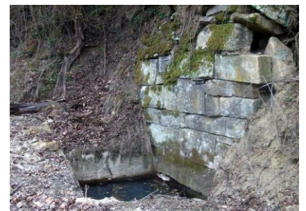
Lugar donde se situaba la fuente construida en 1748

Saltemos en el tiempo. En el mundo rural de los últimos dos siglos, por ejemplo, la necesidad del agua fue la misma, pero con el ejemplo de las ciudades y de los pueblos de mediana y gran población, los pequeños sintieron prisa, siempre ralentizada por la conformidad de unas gentes acostumbra-