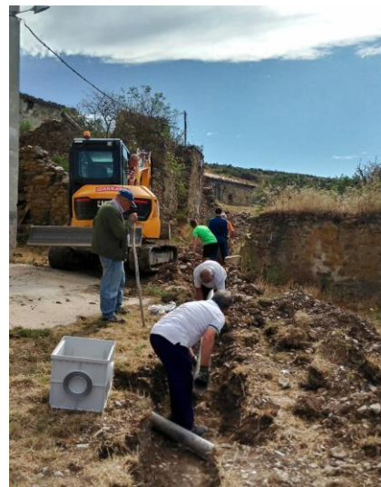
Vecinos de Sarnago en plena faena

Dentro de esta misma fase se dotó al edificio de las escuelas de agua corriente fría y caliente.