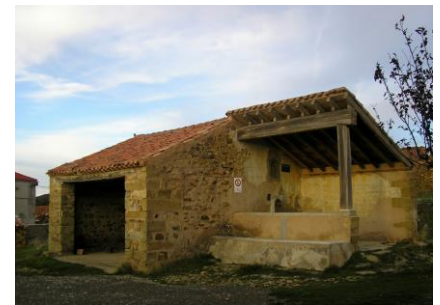
Fuente, pilón y lavaderos construidos en 1917 y reformados en 1991 entre la gente del pueblo

y desatascos. La tubería de hierro fundido databa de 1917 y era muy frecuente que se obstruyera.