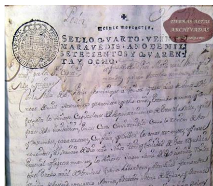
Detalle de la demanda contra la Villa exigiendo le fuese abonado el coste de la fuente.

das a no tener grandes beneficios, de contar con alguna comodidad más dentro del ámbito doméstico. Sintieron más prisa por la instalación más o menos cercana a los hogares, del agua, que por la electricidad, aunque llegaran con poco diferencia de tiempo.